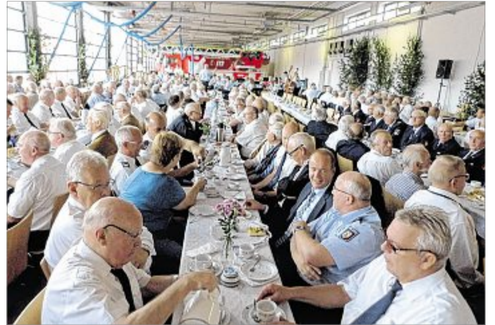
Zum traditionellen Treffen der Ehrenabteilungen der Feuerwehren des Kreises Olpe kamen am Samstag mehr als 250 ehemalige Kameraden ins Olper Feuerwehrgerätehaus.

OLPE Feuerwehrgerätehaus wurde zur Kaffeestube